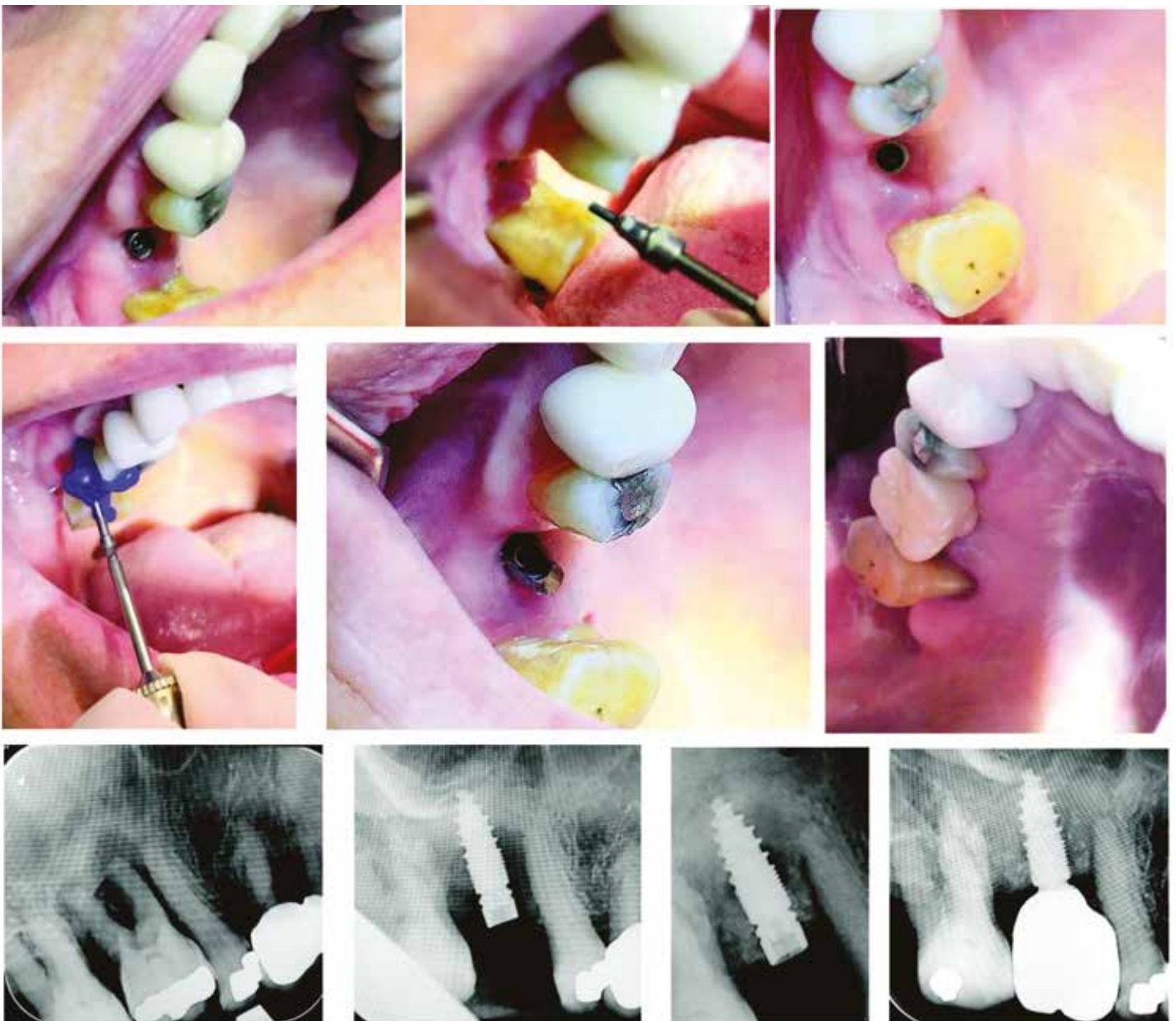
Fig. 23-30: Situation trois mois après extraction-implantation combinée à une greffe autologue via le Smart Dentin Grinder en région 16. Le jour de l'extraction, au fauteuil, la dent du patient est broyée, nettoyée, et mise en place dans l'alvéole résiduelle directement après l'implantation ( Fig. 31 ). Fig. 32: Contrôle de radiographie 6 mois après mise en charge fonctionnelle avec la couronne en zircon.

5) MIMI® et une prophylaxie de péri-implantite efficace entraînent des bénéfices, comme l'exclusion d'une contamination bactérienne à l'intérieur de l'implant pendant la chirurgie également avec un système d'implant bibloc adapté. Tous les implants monoblocs, qui sont posés selon les critères susmentionnés, ne sont pratiquement pas, voire pas du tout atteints d'une péri-implantite même après des années. En effet, l'existence d'un Shuttle sur le (R)Evolution permet de préserver l'implant de toute infiltration bactérienne par infiltration durant toute l'ostéointégration. La partie supérieure de l'implant, le Shuttle - fournie avec la livraison - est à la fois conformateur gingival et vis de cicatrisation stérile. Enfin si le praticien souhaite travailler plus amplement son profil d'émergence, les Gingiva-Clix PEEK (clipsables sur le Shuttle), en six versions, peuvent être clipsés sur le Shuttle.