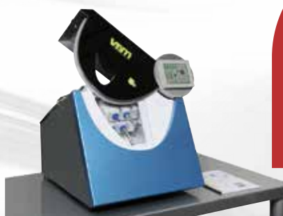
BioDA® 40 Gamme libérale