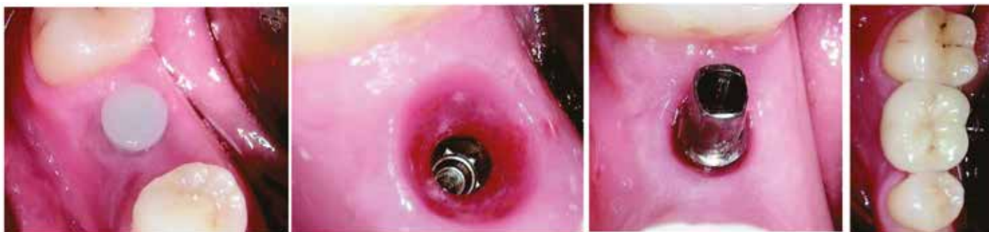
Figure 1: Vue post-opératoire- Pour le patient c'est une intervention non-traumatique, rapide, pratiquement «sans saignement» et sans complications. Images 2-4: En règle générale, les dents unitaires sont réhabilitées avec une prothèse dans la séance suivante environ 8-10 semaines après l'implantation.

D'un point de vue général, dans la plupart des spécialités chirurgicales le concept minimalement invasif gagne en importance: on observe par exemple une généralisation en chirurgie cardiaque de la pose de stent via la cuisse ou le bras évitant ainsi une incision et une suite opératoire plus conséquente. On peut citer également, la chirurgie du caecum réalisée de même en privilégiant une méthode moins traumatique « en trou de serrure » de manière endoscopique. Il est donc regrettable d'observer régulièrement un certain retard dans le domaine de l'implantologie dentaire, et parfois une réticence à envisager de réaliser des traitements moins invasifs. C'est donc après 20 ans de recul clinique et de débats animés que la méthode MIMI® est désormais acceptée, reconnue scientifiquement et largement pratiquée en Allemagne.