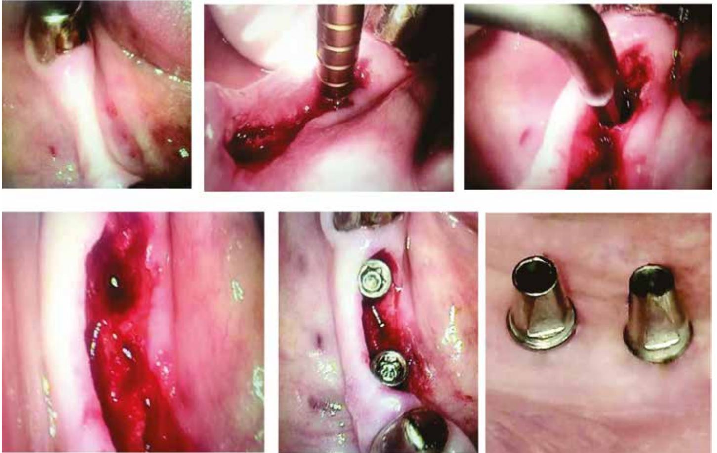
Fig. 7-12: MIMI- II définit la distraction horizontale sans élévation de lambeau mucopériosté. Cette méthode a été décrite en 2002 par le regretté Dr. Ernst Fuchs- Schaller (Zurich) pour toute classe osseuse. À l'aide d'une instrumentation simple, les trois couches (lamelle osseuse vestibulaire, périoste intact, et gencive attachée) sont décalées en vestibulaire. Cette méthode apporte une solution intéressante dans les cas de crêtes minces ou de sites osseux implantaires qui lors de la planification révèle que l'implant n'aura pas de gencive attachée du côté vestibulaire). On obtient après ce décalage axial non seulement un gain important sur le plan horizontal, mais également un véritable « conteneur biologique » propice à la cicatrisation. En pratique, le site est comblé avec des substituts osseux en mésial et distal des implants, p. ex. avec Matribone (distribution Champions Implants) qui gonfle et ne nécessite pas de membrane.

MIMI-III: Le Dr. Ernst Fuchs-Schaller décrit cette classe comme distraction verticale. Cette technique «Garagentor» constitue une base pour d'autres techniques différentes comme la technique de tunnel.