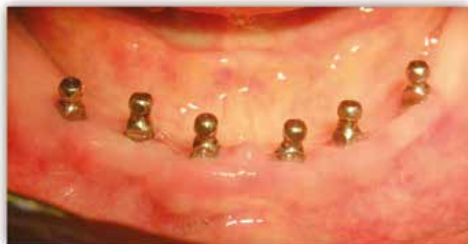
Fig. 6: MIMI- Ib: Les implantations dites différées composent (encore) la majorité des indications. Dans ce cas l'implant est mis en place dans un site cicatrisé. Lorsque qu'une technique de préservation d'os alvéolaire n'a pas été mise en place lors de l'extraction, la greffe est alors régulièrement employée pour obtenir un volume osseux vertical et horizontal suffisant à l'implantation. De plus la présence d'au moins 1mm de gencive attachée en vestibulaire de l'implant constitue un des critères de succès à long terme.