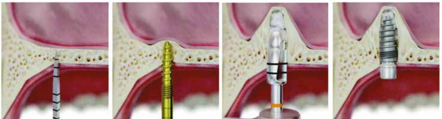
Fig. 13-16: Pour le sinus lift indirect ( MIMI-Va ) et sinus lift direct ( MIMI-Vb ), l'accès ne se fait pas latéralement (comme d'après Tatum) mais par voie de la crête alvéolaire crestale, où l'implant sera posé. Avant l'implantation, lors du sinus lift direct le couvercle osseux est élevé et/ou pénétré et la membrane Schneider est élevée sans blessure avec un greffon et/ou sang. Cela est réalisé avec des instruments simples comme des condenseurs arrondis à l'extrémité, ou avec des forets arrondis avec une rotation anti-horaire à une vitesse faible d'environ 30 - 50 rpm.

La combinaison simultanée de distraction horizontale et verticale est décrite comme MIMI-IV et doit être réalisée par des experts expérimentés plutôt que par des débutants en implantologie.